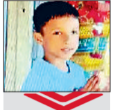
चार बहनों का था इकलौता भाई, पिता की पहले ही हो चुकी है मौत