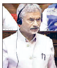
एजेसी ▶▶ नई दिल्ली

संसद में केंद्र सरकार ने सोमवार को पश्चिम एशिया के तनाव पर आधिकारिक बयान दिया। विदेश मंत्री एस जयशंकर ने राज्यसभा में इजराइल-ईरान युद्ध पर बयान देते हुए कहा कि खाड़ी देशों में हालात चिंताजनक हैं और भारत शांति के पक्ष में है। संसद में पश्चिम एशिया की मौजूदा स्थिति पर विदेश मंत्री एस जयशंकर ने राज्यसभा में बयान देते हुए कहा कि 28 फरवरी से क्षेत्र में तनावपूर्ण माहौल बना हुआ है और खाड़ी के कई देशों में हालात चिंताजनक हैं। उन्होंने कहा कि भारत सरकार लगातार स्थिति पर नजर बनाए हुए है और वहां रह रहे भारतीयों की सुरक्षा उसकी सर्वोच्च प्राथमिकता है। इस मुद्दे पर सुरक्षा मामलों की कैबिनेट समिति की बैठक में भी विस्तार से चर्चा की गई थी और सभी संबंधित विभागों को जरूरी निर्देश दिए गए हैं। विदेश मंत्री ने कहा, पश्चिम एशिया में हो रहे घटनाक्रम सभी के लिए गहरी चिंता का विषय हैं और भारत का मानना है कि किसी भी विवाद का समाधान संवाद और कूटनीतिक प्रयासों से ही निकाला जाना चाहिए। सरकार ने हालात पर नजर रखने के लिए एक स्पेशल कंट्रोल रूम भी बनाया है जो क्षेत्र में मौजूद भारतीयों से संपर्क बनाए रखने और उन्हें हर संभव सहायता उपलब्ध कराने का काम कर रहा है। भारत ने एक बार फिर स्पष्ट किया कि वह क्षेत्र में शांति और स्थिरता का समर्थक है और तनाव कम करने के लिए सभी पक्षों के बीच बातचीत को जरूरी मानता है।