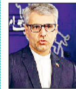
वाशिंगटन

ईरान के विदेश मंत्रालय के प्रवक्ता बघाई ने अमेरिका पर ईरान के तेल संसाधनों पर कब्जा करने की साजिश का आरोप लगाया है। उन्होंने कहा कि उनका योजना साफ है, उनका मकसद बिल्कुल स्पष्ट है- वे हमारे देश को बांटकर हमारी तेल संपदा पर अवैध कब्जा करना चाहते हैं। बघाई ने आगे कहा कि उनका उद्देश्य हमारी संप्रभुता का उल्लंघन करना, हमारी जनता को पराजित करना और हमारी मानवीय गरिमा को कुचलना है। ईरान के विदेश मंत्रालय के प्रवक्ता बघाई ने कहा है कि ईरान क्षेत्र के देशों के साथ अच्छे और मैत्रीपूर्ण संबंध बनाए रखने के लिए दृढ़संकल्पित है, भले ही युद्ध शुरू होने के बाद से इनमें से कई देशों पर ईरानी मिसाइलों और ड्रोन से हमले किए गए हों।