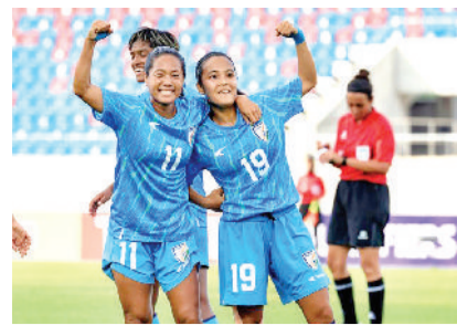
7 चीनी ताइपे के खिलाफ करो या मरो के मुकामले के लिए तैयार भारत